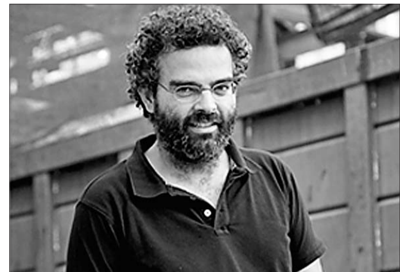
Gonçalo M. Tavares vem ao Luxemburgo para apresentar a sua recolha de poesia "Pedra, Pierre, Steen", em edição trilingue – português, francês e luxemburguês

Gonçalo M. Tavares (GMT) nasceu em Agosto de 1970 em Luanda. Autor extremamente talentoso e prolífico, Tavares publicou a sua primeira obra em 2001 e, em menos de uma década, vai já a caminho das três dezenas de obras publicadas, todas de grande qualidade e reconhecido valor, da poesia ao teatro, passando pelo romance. Tavares recebeu dos mais importantes prémios da literatura portuguesa: o Portugal Telecom 2007, o Prémio José Saramago 2005 e o Prémio Ler/Millennium BCP 2004, com o romance "Jerusalém", obra que o revelou ao grande público e que foi o romance escolhido pelos críticos do jornal Público para "Livro da Década"; o Prémio Branquinho da Fonseca da Fundação Calouste Gul-