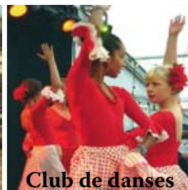
Club de danses espagnoles Flamenco