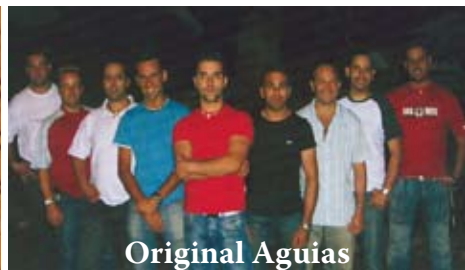
Original Aguias musiques traditionnelles portugaises et répertoire de chansons internationales