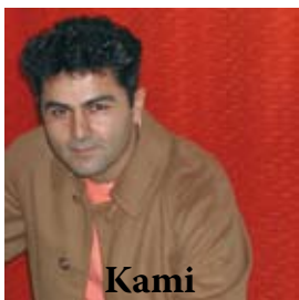
Kami musique iranienne et turque