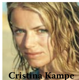
Cristina Kampe chant, danse, musique pop de Roumanie