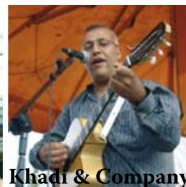
Khadi & Company musiques du monde (France)