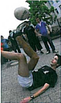
À Gasperich, des animations ont complété la soirée.