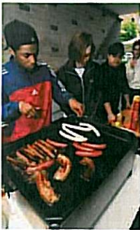
La maison des Jeunes Amigo avait prévu quelque 200 grillades.