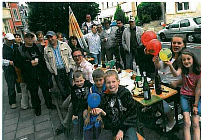
La pluie n'a pas dissuadé les voisins de la rue Michel-Rodange à Esch-sur-Alzette où des tables ont été installées pour déguster ce que chacun est venu apporter.

prendre part à l'opération «Immeubles en fête». En 2002, la dynamique s'amplifie encore : 126 municipalités et offices HLM sont partenaires. Pour cette 3 e édition nationale française, plus de deux millions d'habitants se sont mobilisés dans toute la France. En 2003, Immeubles en fête a pris une dimension internationale et s'est installé en Belgique et dans 10 villes européennes. Cette première édition européenne a permis d'atteindre les trois millions de participants. Lors de la 4 e édition, le 29 mai 2008, plus de 8 millions d'Européens se sont mobilisés. Cette année, les communes luxembourgeoises participantes à la manifestation étaient les suivantes : Beckerich, Bettembourg, Differdange, Dudelange, Esch-sur-Alzette, Hesperange, Hobscheid, Leudelange, Luxembourg, Mamer, Mondorlange, Reckange-sur-Mess, Remich, Rumelange, Steinsel, Strassen.