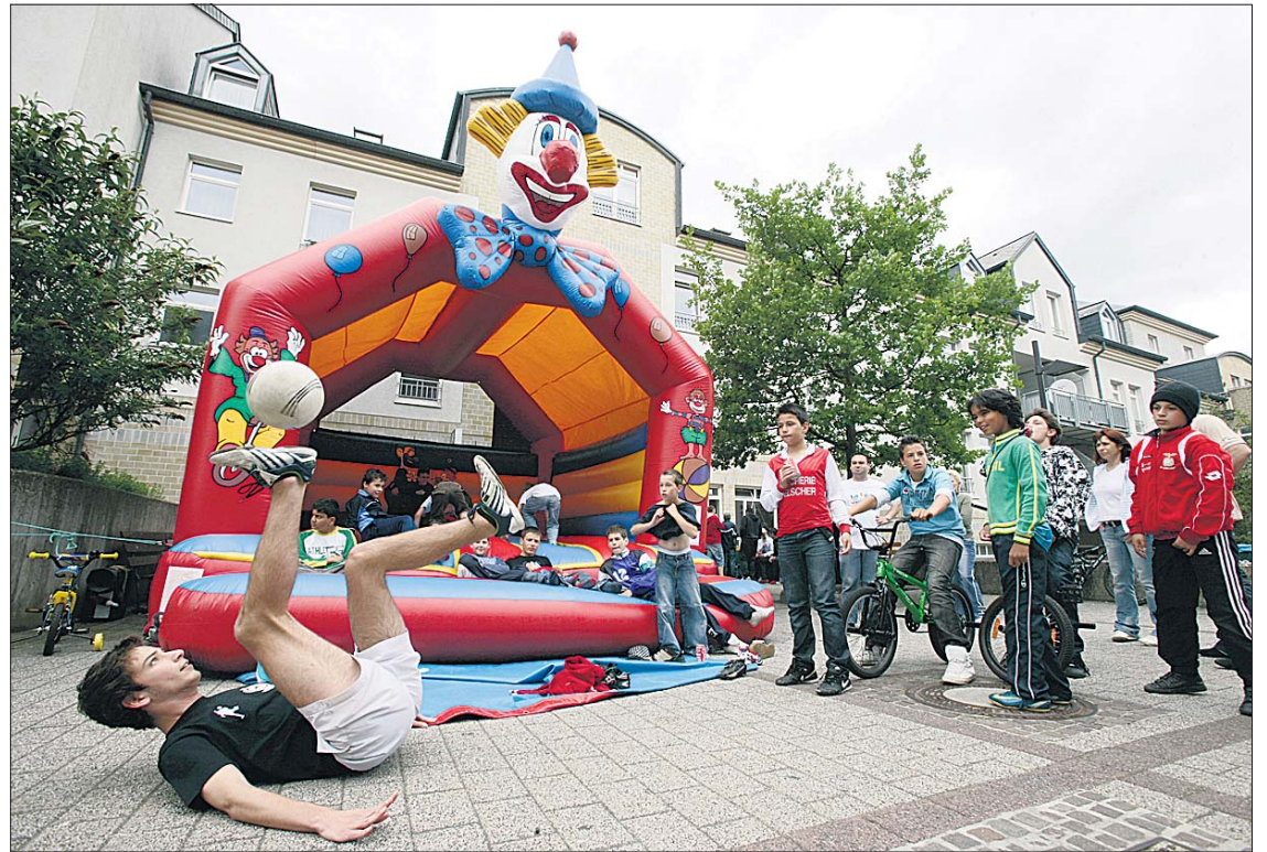
A Gasperich, place du Sauerwiss , les associations locales avaient invité tous les voisins pour une petite fête

L' Internetstuff « Bierger.www », la maison des jeunes de Gasperich, Inter-Action asbl, «Il était une fois» asbl et les voisins du quartier ont organisé ensemble, pour la première fois, leur fête des voisins. La fête a commencé vers 16 heures avec une animation musicale et artistique. La maison des jeunes de Gasperich et Inter-Action asbl ont présenté des ateliers de break-dance et de free-style . «Il était une fois» asbl a animé la fête avec son atelier de painting et d'autres activités pour les enfants, qui ont pu s'amuser dans un château gonflable. L' Internetstuff avait installé une section nouvelles technologies, et une animation DJ via ordinateur. Un stand gastronomique avec des spécialités luxembour-