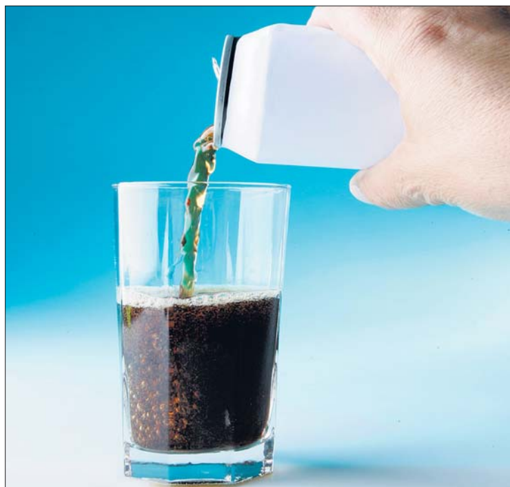
Cactus und Auchan haben die Cola von Red Bull aus den Regalen genommen. Delhaize und Cora führen sie nach wie vor im Angebot, weil „keine Gefahr für die Gesundheit der Verbraucher besteht.“

Ob von aufputschenden Getränken eine Suchtgefahr ausgehe, dazu erklärte Thérèse Michaelis vom „Centre de prévention des toxicomanies“ (Cept), dass man allgemein vom Verzehr solcher Getränke abrate. Allerdings habe laut bisheriger Untersuchungen die Cola von Red Bull keine psychoaktive Wirkung.