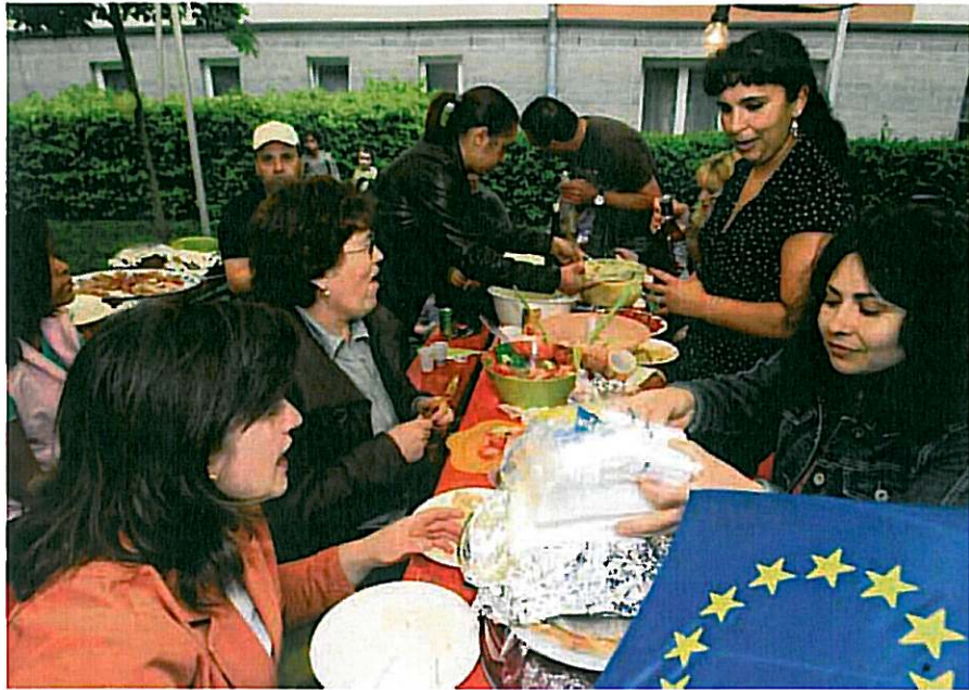
À Eich, près de la maison des Jeunes Amigo (ASTI), de nombreuses familles se sont retrouvées sous les stands pour partager les petits plats froids et chauds.