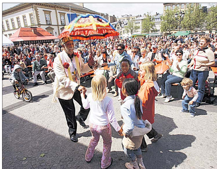
L'an passé, 8.000 spectateurs ont assisté au festival