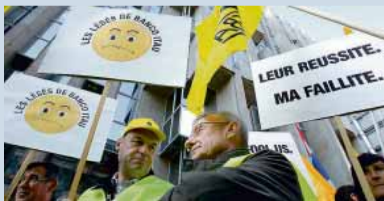
Une soixantaine de manifestants s'étaient réunis devant la banque.

Aux côtés des syndicats OGBL et LCGB, l'Association luxembourgeoise des employés de banque et d'assurances (Aleba) avait organisé, hier, un piquet de protestation devant l'immeuble de la Banco Itau. La partie banque privée du groupe Itau-Unibanco va quitter en 2012 le Luxembourg au profit de la