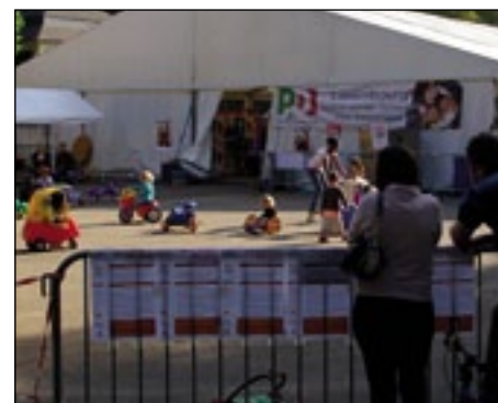
FESTA DELL'UNITÀ, ESCH-SUR-ALZETTE, 2011

lieu à Esch-sur-Alzette en 1971. Cette fête ouverte à tous était une sorte de « revanche démocratique » de nos compatriotes. Le lieu ne pouvait être qu'Esch-sur-Alzette, une ville fortement ouvrière avec une immigration italienne extrêmement présente dans tout le sud du pays ainsi que dans la région frontalière française. Je tiens à souligner avec fierté que la Festa dell'Unità de Esch-sur-Alzette est l'unique édition qui se déroule hors de l'Italie. Le mérite en revient aux amis, camarades italiens du Luxembourg qui ont tenu obstinément, tout au long de ces quarante années, à organiser cet événement pour dire les idéaux et valeurs de gauche.