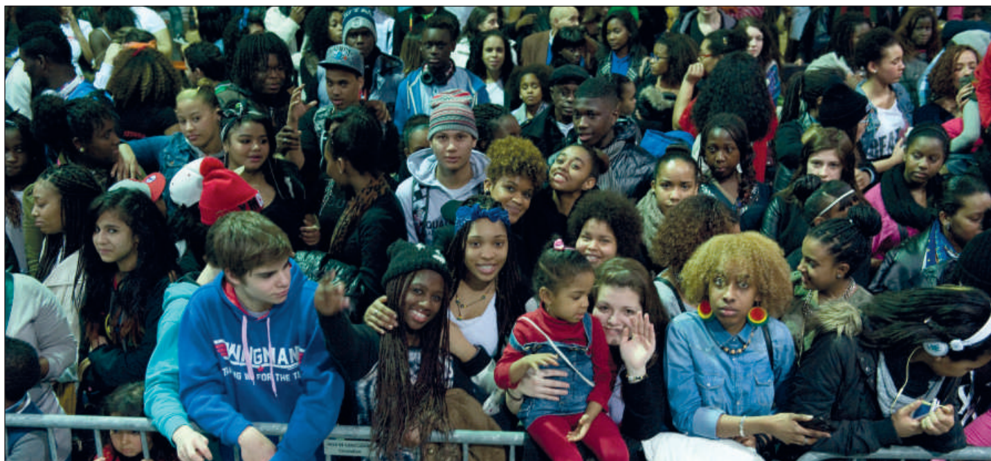
30E FESTIVAL DES MIGRATIONS, DES CULTURES ET DE LA CITOYENNETÉ - LUXEMBOURG, 15/16/17 MARS 2013