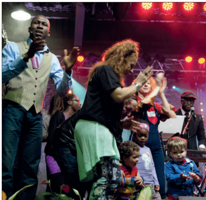
30E FESTIVAL DES MIGRATIONS, DES CULTURES ET DE LA CITOYENNETÉ - LUXEMBOURG, 15/16/17 MARS 2013