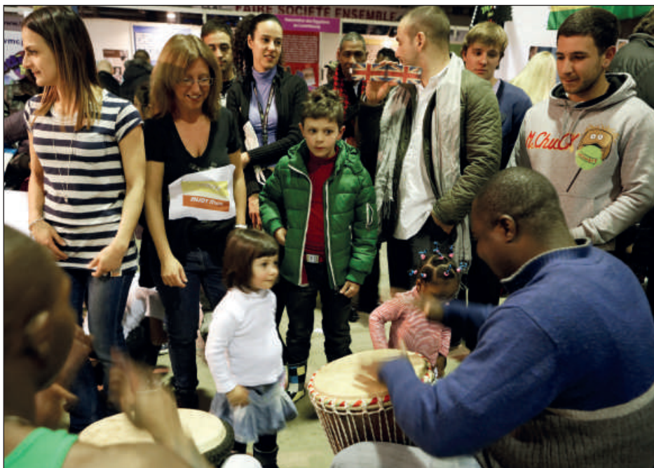
30E FESTIVAL DES MIGRATIONS, DES CULTURES ET DE LA CITOYENNETÉ - MARS 2013