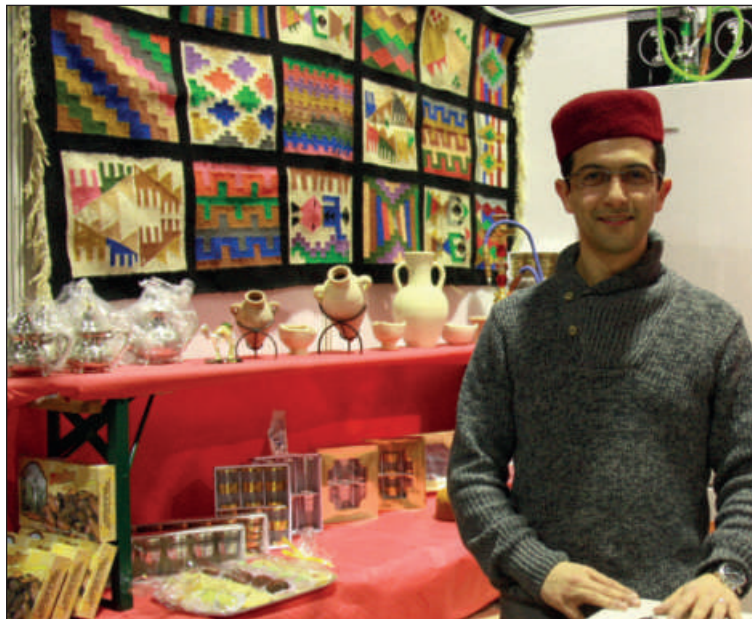
STAND DE L'AMITIÉ TUNISIE LUXEMBOURG AU 30 e FESTIVAL DES MIGRATIONS, DES CULTURES ET DE LA CITOYENNETÉ MARS 2013 - PHOTO : CLAE - LIVIJA JEGOROVA

De nouveaux objectifs ont été définis et depuis 2012, nous avons lancé plusieurs projets. L'association a fait