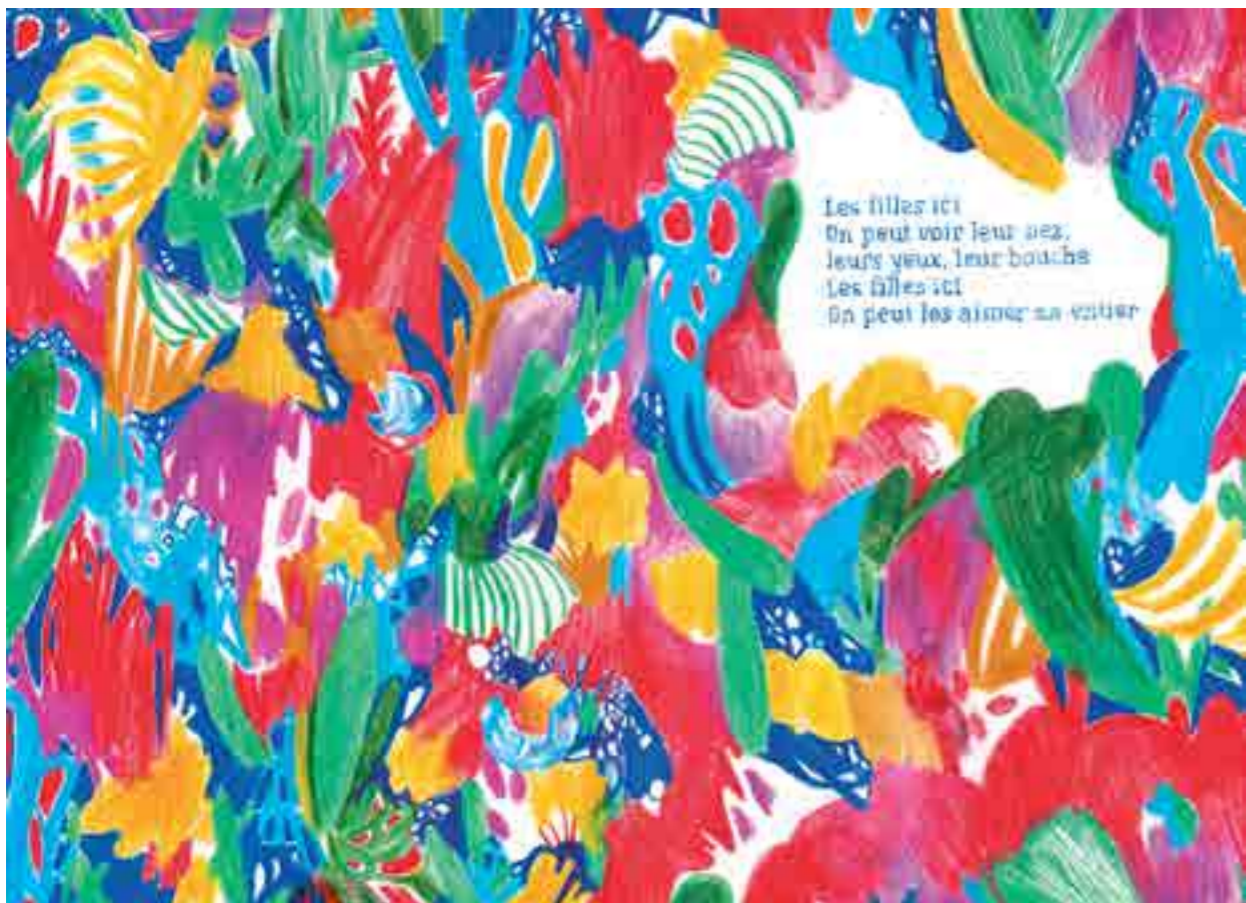
Une pomme parce que c'est doux