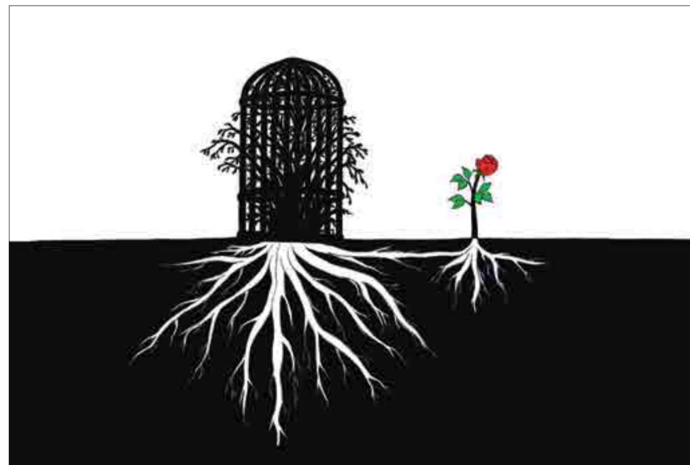
Hope (oil painting, 60 x 80 cm) « When limits are set for thought, for creativity, and for freedom... When the circumstances overwhelm you, life suffocates you, and the constraints weaken you... Migrate to the distant lands where the sun shines twice, and the Spirit is born of a branch and a dream. Get away and take with you some of your roots and a lot of hope – a man without hope and roots will not blossom in any land. » Abnonour Alsori, painter